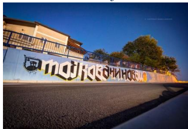
Slika 2: Mojkovac