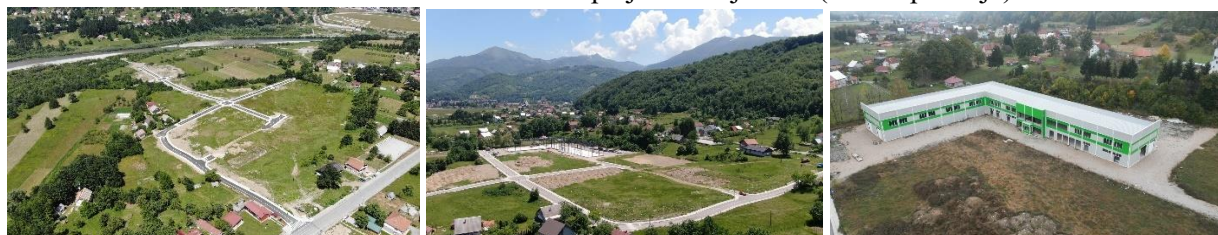
Slika 1: Biznis zona “Babića polje” – Mojkovac (iz više pozicija).

horizontalnu signalizaciju kao i elektroenergetske i telekomunikacione instalacije. U biznis zoni je izgrađena trafostanica 10/0,4 kV 1x1, 630 kVA za potrebe korisnika biznis zone. Zona se nalazi u neposrednoj blizini magistralnog puta i auto-puta koji vodi do glavnog grada, zatim željezničke pruge (oko 3km) koja vodi do luke Bar, postoji odlična saobraćajna povezanost sa svim državama u regionu: Srbijom, Bosnom i Hercegovinom, Hrvatskom i Albanijom.