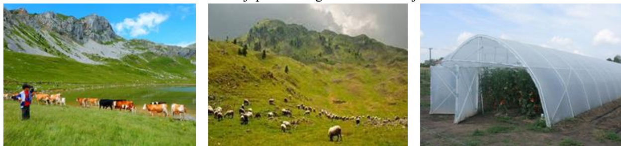
Slika 5: Poljoprivredna gazdinstva u Mojkovcu

Pčelarstvo predstavlja dodatnu djelatnost obično uz neku drugu granu poljoprivrede. Registrovana su tri udruženja pčelara sa ukupno 202 člana. Na teritoriji opštine broj košnica je 4552 koje godišnje proizvedu 38 t meda, ova količina varira od sezone do sezone.