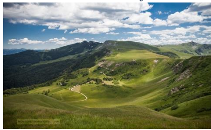
Slika 3: Planina Bjelasica