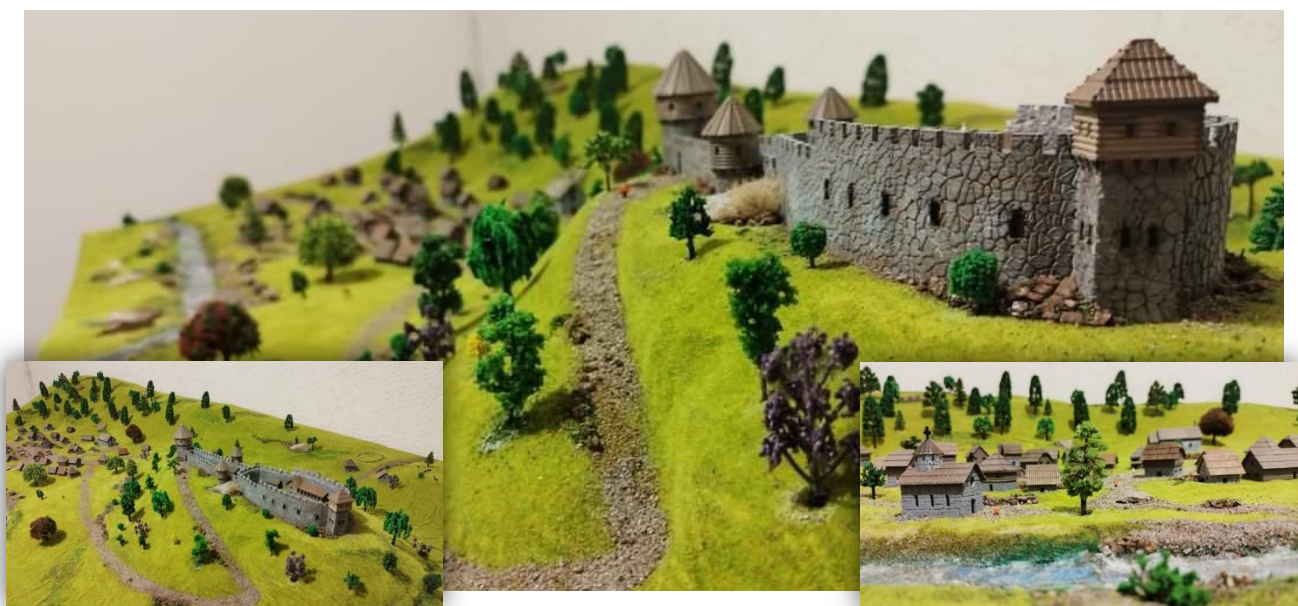
Слика 6. Макета средњовјековног Брскова

Руководство општине интезивно ради на убрзању пројекта дигиталне реконструкција утвђења Градина и рударског насеља Догањица кроз 3Д виртуелну туру која ће представљати шетњу кроз прошлост. Овај локалитет је од непроцјењивог значаја за општину Мојковац, којем ћемо утврдити будућу намјену. Одредићемо пројектни задатак и смјернице за израду идејног пројекта реплике средњовјековног краљевског и престоног града Брскова. Изградњом реплике срењовјековног Брскова и његовом афирмацијом Мојковац ће постати препознатљив културно туристички центар и ван граница Црне Горе.