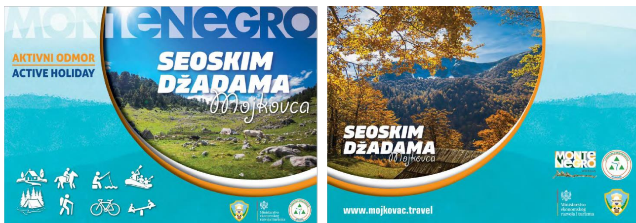
Слика 8. Брошура „Сеоским џадама“

Недавно је објављен Каталог сеоских домаћинстава Мојковца под називом “Сеоским џадама Мојковца” који садржи попис свих домаћинстава из Мојковца и на репрезентативан и маркетиншки примамљив начин презентује руралне капацитете наше општине. Поред тога, поставили смо и путоказе који показују правац и удаљеност од сеоских домаћинстава.