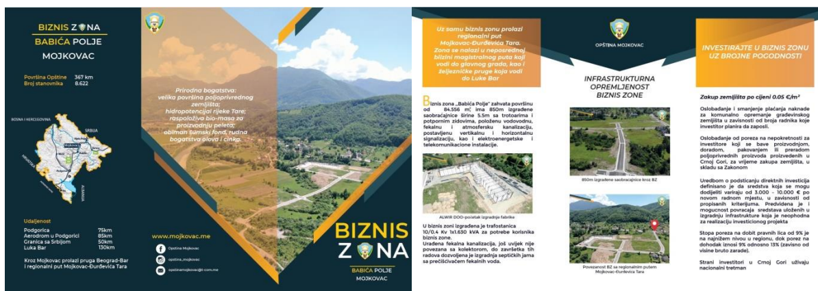
Слика 2: Нова броштура

За промоцију пакета подстицајних мјера за инвеститоре који своје пословање планирају реализовати у бизнис зони, креирали смо нову броштуру (тројезични промотивни материјал).