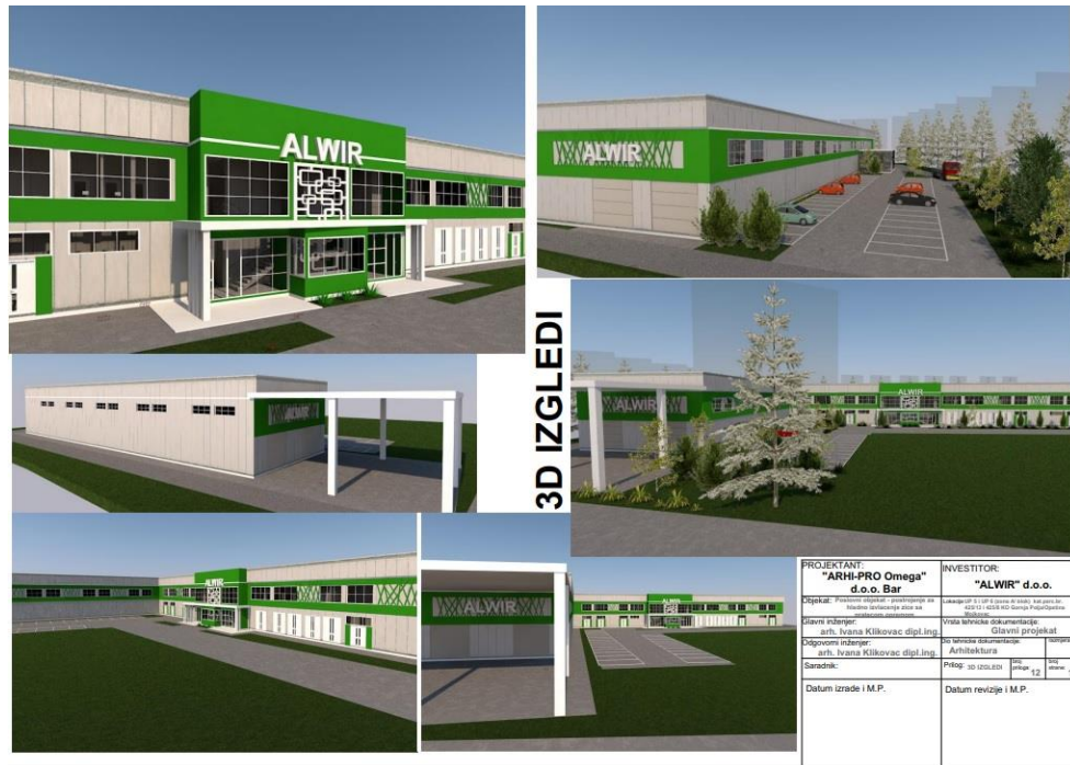
Слика 1: Идејно рјешење фабрике

Раније уложена средства у Бизнис зону од око 900 000 € обезбиједила су потпуну инфраструктурну опремљеност што је уз добар пакет подстицајних мјера довело до изградње прве фабрике у бизнис зони. У питању је производња жичаних производа, ланаца и опруга а број запослених у овој фабрици ће бити преко 20. Изградња објекта је у завршној фази и биће реализована у првој половини 2023. године.