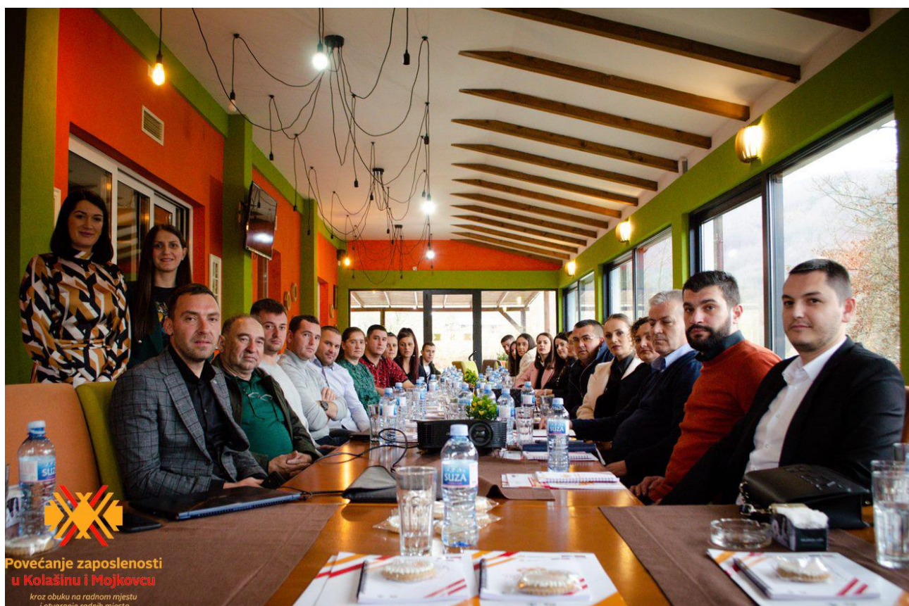
Слика 3: Завршна конференција пројекта „повећање запослености у колашину и Мојковцу кроз обуку на радном мјесту и отварању радних мјеста

Реализовали смо пројекат „Повећање запослености у Колашину и Мојковцу кроз обуку на радном мјесту и отварање радних мјеста“ који је дио Позива за додјелу бесповратних средстава – грант шеме „Подршка запошљавању у мање развијеним општинама у Црној Гори“ финансираног из фондова Европске уније у оквиру ИПА II Програма ЕУ и ЦГ за запошљавање, образовање и социјалну заштиту (СОПЕЕС 2015-2017). Овим пројектом Општина Мојковац је обезбједила бесповратна средства за 5 (пет) послодаваца у укупном износу од 100 000 €. Зависно од испуњености услова дефинисаних Јавним позивом, послодавци су добили бесповратна средства од по 10 000 €, 20 000 € и 30 000€ по основу којих је обучено за рад 20 лица са евиденције ЗЗЗЦГ од којих је њих 12, након реализоване обуке, закључило радни однос.