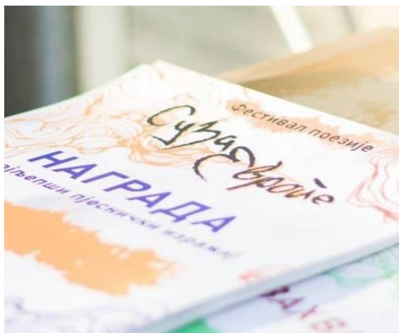
Слика 7. Манифестација „Суза Европе“

Ово су само дио активности које су Општина и њене службе реализовале у протеклом периоду. Као одговорна установа наставићемо да чинимо све што је у нашој моћи, и поред скромних финансијских средстава, да унаприједимо услове за живот нашим суграђанима.